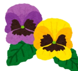
さんさん館前通りの 花いっぱい運動