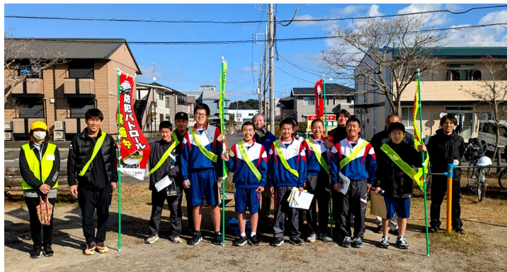
松ヶ丘1区防犯 キャンペーン メンバー